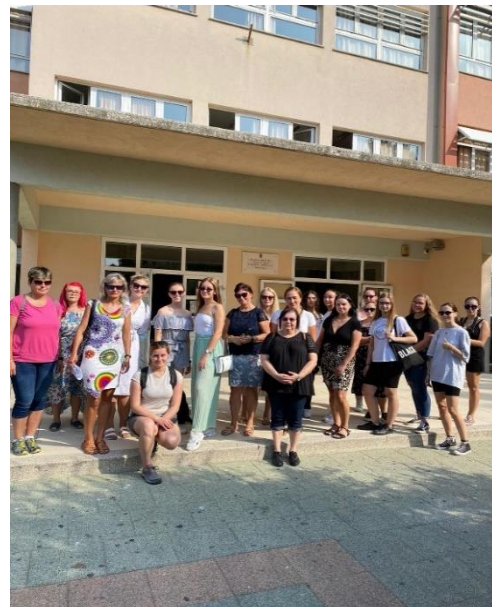
Foto: Ve škole tam zvoní, stejně jako u nás